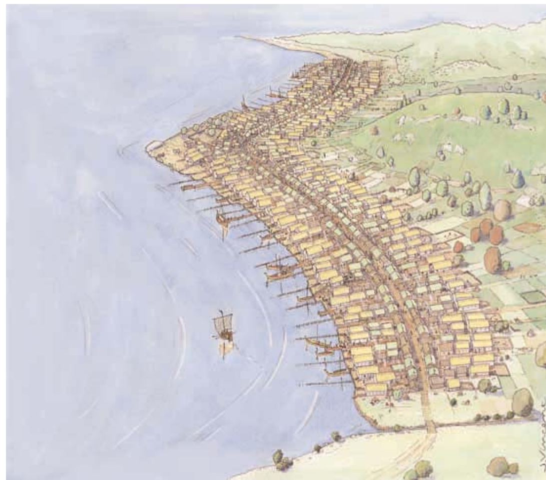
Sigtuna omkring år 1000. Rekonstruktion av Jacques Vincent efter vetenskapligt underlag av Sten Tesch. Sigtuna circa AD 1000. Reconstruction by Jacques Vincent, based on scientific research by Sten Tesch.

Sigtuna var från början en helt och hållet kristen stad. Hedniska gravar saknas även på de äldsta gravgårdarna. De första träkyrkorna byggdes dock inte