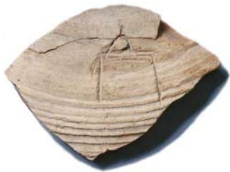
Amforaskärvan med rurikidernas vapenmärke från Sigtuna.

Amphora fragment from Sigtuna with crest of the Rurikovichs.